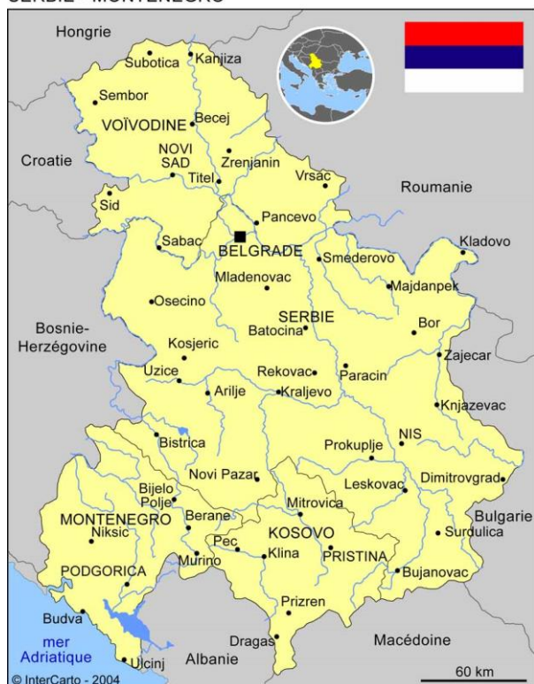
SERBIE - MONTENEGRO